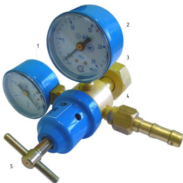
а) ДЖЕТ.156.00.00.00, -02, -05, -09

4.1 Внешний вид редуктора показан на рис.1, 2