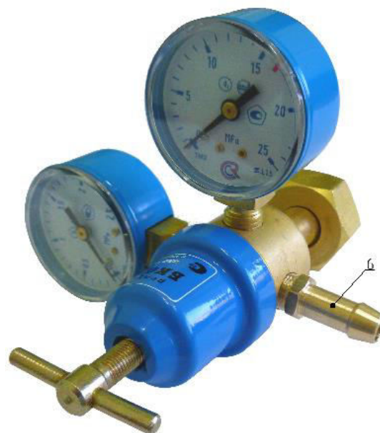
б) ДЖЕТ.156.00.00.00-03, -07