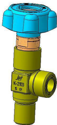
Рис.1 Клапан К-2103-400 DN6 ДЖЕТ 481 10 00 00, -01, -02, -05

4.3 Поверхность А смазана кислородной смазкой ВНИИ НП-282 по ТУ 38.10112661-89 для исполнений -00, -03, -05, -06. Допускается применение смазки ЦИАТИМ-201 ГОСТ 6267 для исполнений -01, -02, -04, -07.