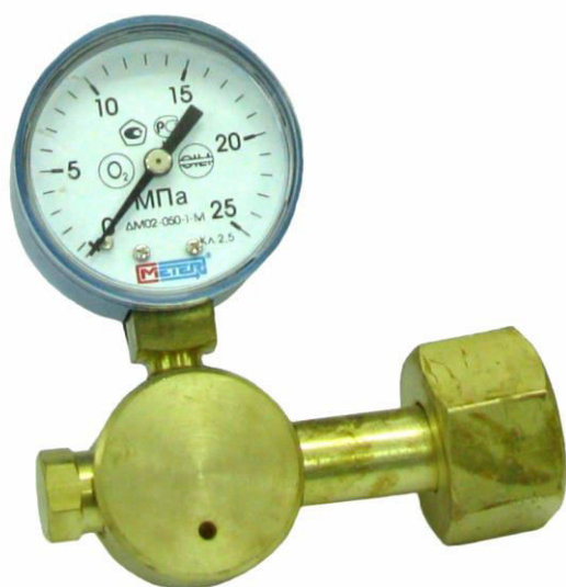
Рис.1 Узел измерительный ДЖЕТ 214 02 00 00, -05

Внешний вид узла измерительного в зависимости от исполнения приведен на рис. 1, 2, 3, 4, 5