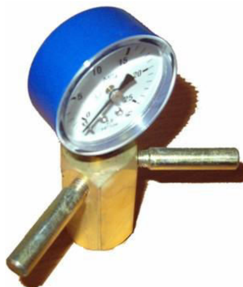
Рис.2 Узел измерительный ДЖЕТ 214 02 00 00-01, -04