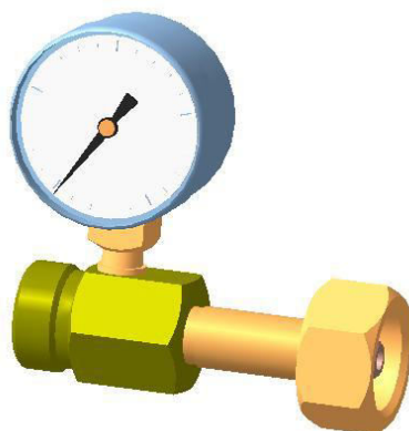
Рис.5 Узел измерительный ДЖЕТ 214 02 00 00-10 ... -19