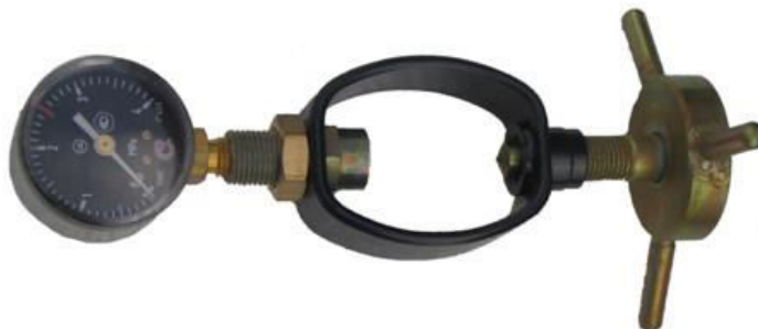
Рис.3 Узел измерительный ДЖЕТ 214 02 00 00-02