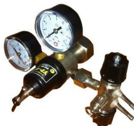
Рис.2 Редуктор УР-6П