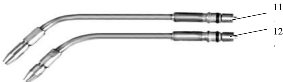
Рис.3 Наконечники горелки в сборе.

11 - наконечник для сварки 3А, 3П, 12 - наконечник для сварки 2А, 2П