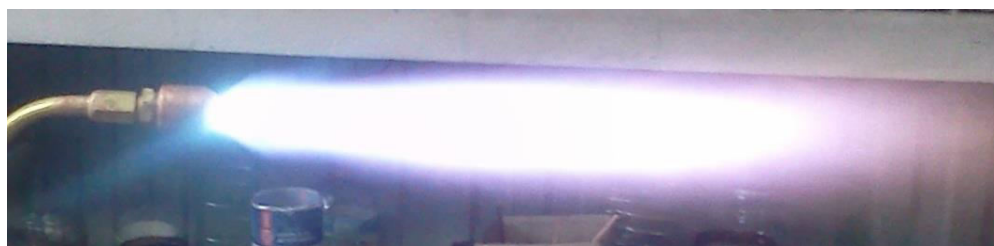
Рис.2 Пламя горелки ГЗУ ДЖЕТ 480 (7)

5.4 Откройте на 1/4 оборота кислородный клапан и на 1/2 оборота клапан горючего газа, зажгите горючую смесь. Отрегулируйте клапанами горелки «нормальное» пламя, в случае неправильной формы ядра пламени необходимо прочистить и продуть выходные каналы мундштука. Правильная форма пламени показана на рис.2.