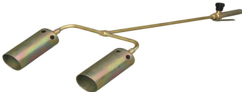
Рис.3 Горелка модели ГВ ДЖЕТ 119-20

5.12 При работе с горелкой модели ГВ ДЖЕТ 119-21 следует применять средства защиты рабочего от высокой температуры.