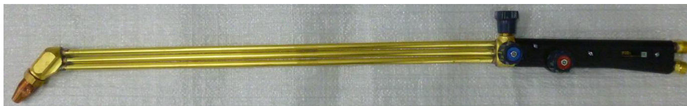
Рис 2 Резак в сборе РЗПт (L=840 мм) с углом наклона мундштуков 135°

1- клапан режущего кислорода; 2- клапан подогревающего кислорода; 3- клапан горючего газа; 4- ствол; 5- корпус мундштуков; 6- гайка смесителя; 7- наружный мундштук; 8- внутренний мундштук.