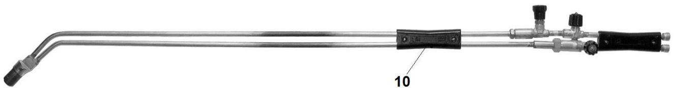
Рис. 2 Резак РЗПсб (L=1300, 1500 мм)