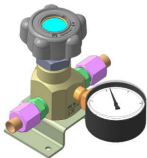
Рис.1 Клапан запорный К-1104-16 (исполнение с манометром)

Применение другой смазки категорически запрещается!