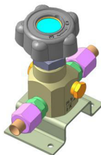
Рис.2 Клапан запорный К-1104-16 (исполнение без манометра)