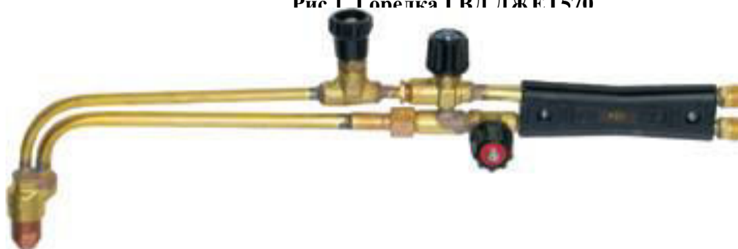
Рис 1. Горелка ГРЛ ЛЖЕТ570