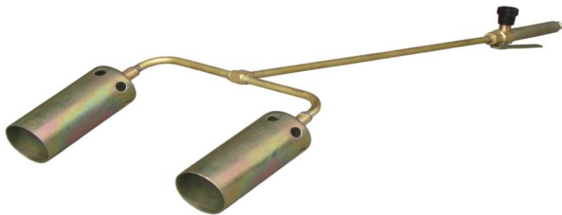
Рис.3 Горелка модели ГВ ДЖЕТ 119-20

5.12 При работе с горелкой модели ГВ ДЖЕТ 119-21 следует применять средства защиты рабочего от высокой температуры.