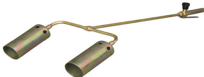
Рис.3 Горелка модели ГВ ДЖЕТ 119-20

4.2 Принцип работы горелок - инжекторный. Дозирующий газовый жиклер расположен в основании наконечника. Горючий газ через жиклер попадает в наконечник и через боковые отверстия засасывает воздух для образования смеси. Образовавшаяся смесь сгорает, образуя пламя на выходе из наконечника.