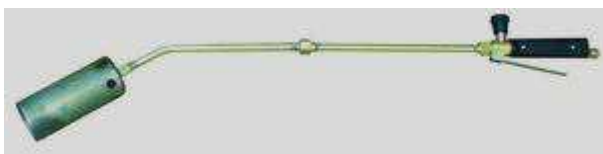
Рис.2 Горелка модели ГВ ДЖЕТ 119-32