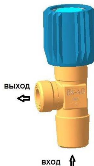
Рис.1 Вентиль ВК-40

Jet – товарный знак предприятия ЛЦ-40С – материал корпуса 15 02 – год и месяц изготовления